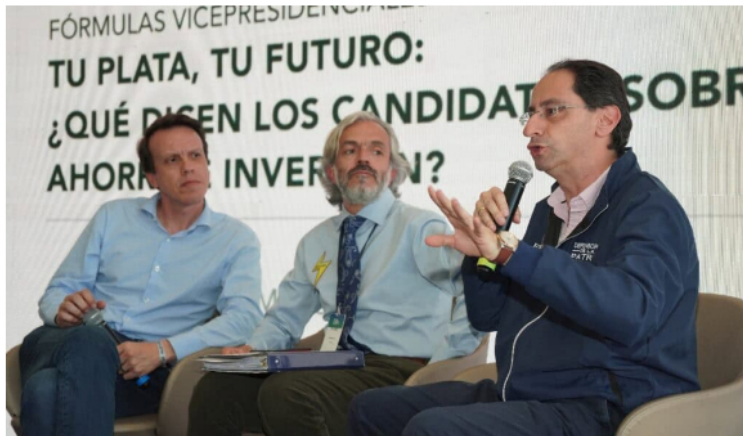
José Manuel Restrepo, fórmula vicepresidencial de Abelardo de la Espriella.