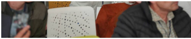
Debate de candidatos a la Vicepresidencia de Colombia, en el Funds Investors Summit 2026.