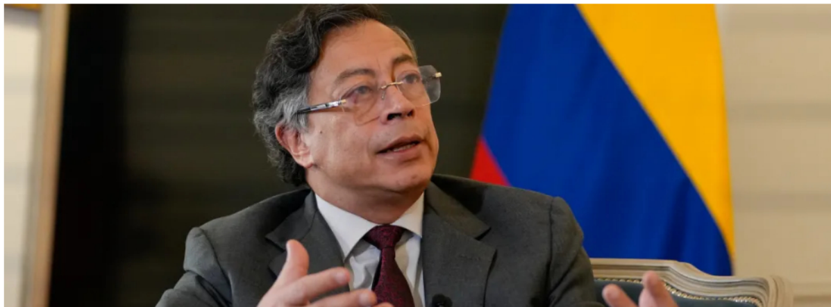
Foto: Presidente Gustavo Petro.