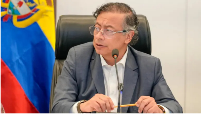
Gustavo Petro.

El presidente ha rechazado de manera tajante estas versiones, las cuales la agencia de noticias AP informó basada en registros de la DEA.