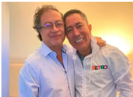
Ricardo Roa, presidente de Ecopetrol, investigado por la Procuraduría por presunto conflicto de intereses en millonaria compra inmobiliaria

Mientras el Gobierno defiende a Roa, la Unión Sindical Obrera adoptó una postura radicalmente diferente. El sindicato exigió a la junta directiva de Ecopetrol apartar al directivo de su cargo, argumentando que las investigaciones que pesan sobre él generan riesgos tangibles para el funcionamiento y la estrategia corporativa de la empresa.