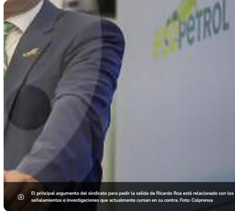
El principal argumento del sindicato para pedir la salida de Ricardo Roa está relacionado con los señalamientos e investigaciones que actualmente cursan en su contra.