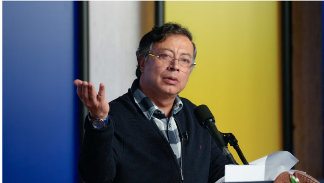
Gustavo Petro, presidente de Colombia.

El mandatario acusó a grupos empresariales de usar "testigos estafadores" para desestabilizar la petrolera y reveló presuntas irregularidades previas.