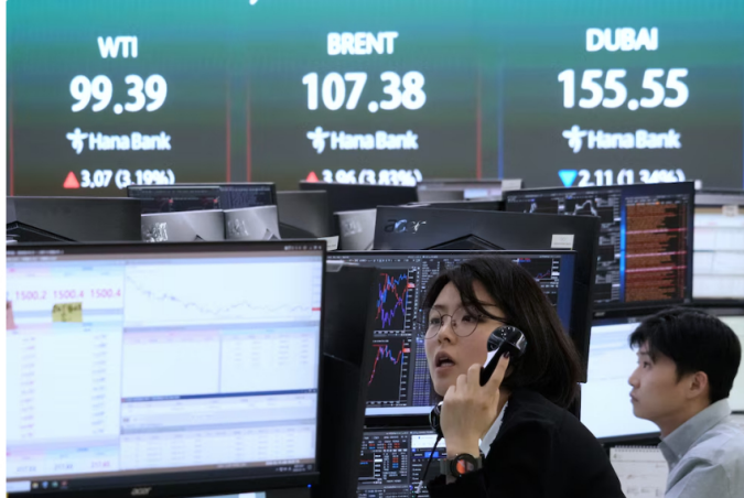
El precio del crudo brent subió un 64% en veinte días por el conflicto en Medio Oriente, alcanzando US$119 el 9 de marzo según La República

El precio del crudo brent llegó a un máximo de US$119,50 el 9 de marzo, como resultado directo de la escalada bélica en Medio Oriente. Este incremento se traduce en presiones inflacionarias para diversas economías y eleva la probabilidad de recesión a 32% , condicionando las perspectivas económicas mundiales.