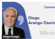
(OPINIÓN) Divide y reinarás. Por: Diego Arango O