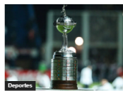
DIM se verá la cara ante Flamengo en la Libertadores