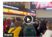
(EN VIDEO) Alto flujo de viajeros se registró en El Dorado, extensas filas en salidas internacionales