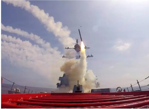
La tensión entre Estados Unidos, Israel e Irán disparó las cotizaciones del petróleo y el gas, aumentando la volatilidad en los mercados energéticos globales.

La escalada del conflicto en Medio Oriente disparó los precios del petróleo y del gas natural en marzo, con alzas de hasta 49% en el Brent y de 96% en la referencia europea del gas. El impacto ya modifica las previsiones energéticas globales y anticipa presiones fiscales y de precios en Colombia.