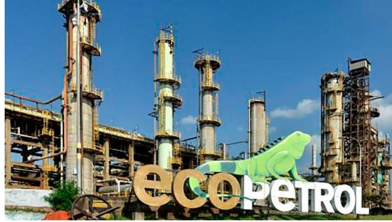
Ecopetrol ofrecerá en venta entre 39 y 68 millones de barriles diarios de gas natural, de enero a mayo de 2026

Las acciones de Ecopetrol registraron un fuerte repunte en los mercados, alcanzando niveles que no se veían desde hace más de tres años, en un contexto marcado por el alza del petróleo y la incertidumbre sobre la continuidad de su presidente, Ricardo Roa.