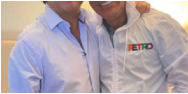
El presidente Gustavo Petro y Ricardo Roa en campaña.

La mayoría de miembros de junta (fichas del Gobierno, el principal accionista de Ecopetrol ) se inclinan a seguir los lineamientos de Casa de Nariño, desde donde se insiste en mantener a Roa.