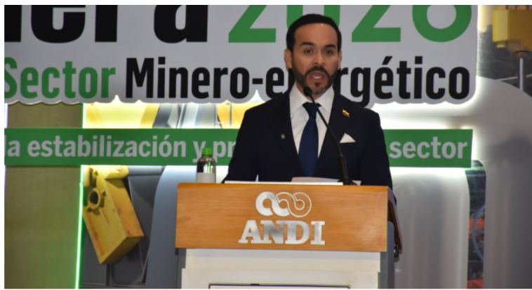
El candidato presidencial Abelardo De La Espriella.