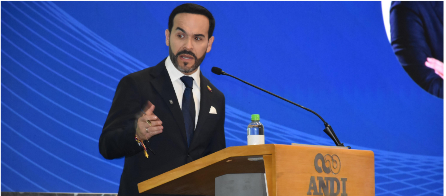
El candidato presidencial Abelardo De La Espriella.