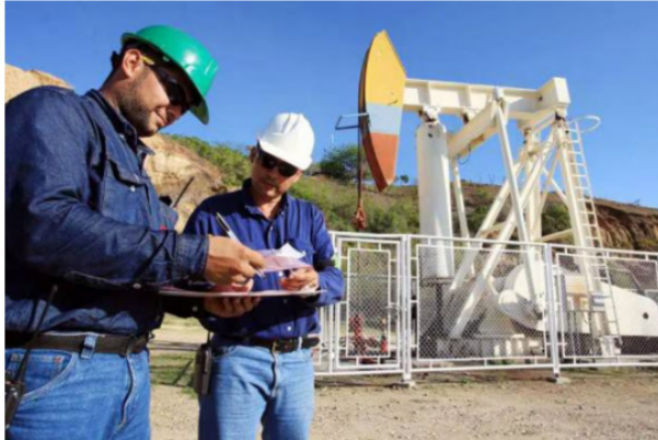
Ronda 2014 avanza con 39 petroleras en proceso de habilitación

Además: Apagón en Refinería de Cartagena obligó a suspender operaciones de Ecopetrol: ¿hay riesgo de desabastecimiento?