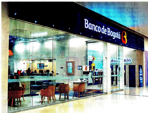
Sucursal de Banco de Bogotá, de Grupo Aval. Con los últimos reconocimientos, la entidad bancaria consolida su liderazgo en innovación y experiencia del cliente.

como un indicador clave de liderazgo en la industria financiera global. A este reconocimiento financiero se suma un logro en el frente de innovación digital. El banco fue galardonado