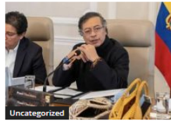
Uncategorized Petro condiciona desalinizadora en Taganga a aval étnico y redefine prioridades de agua en Santa Marta