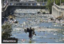
Atlántico Juzgado ordena medidas urgentes por contaminación en arroyo de Galapa