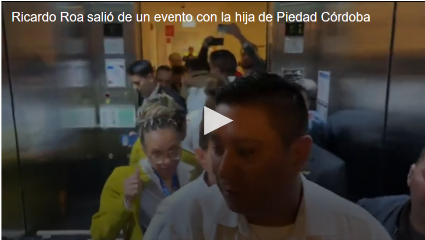
El presidente de Ecopetrol se enfrenta a dos procesos legales

El silencio de Ricardo Roa, presidente de Ecopetrol , tras un foro celebrado en Bogotá el 18 de marzo de 2026, coincidió con una intensificación de las acusaciones sobre la remodelación millonaria de su apartamento en el norte de la capital colombiana.