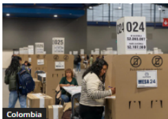
Colombia Escrutinios confirman consistencia electoral con mínima variación frente al preconteo