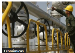
Económicas El petróleo superó los 110 dólares tras ataques en Medio Oriente y subió la tensión global