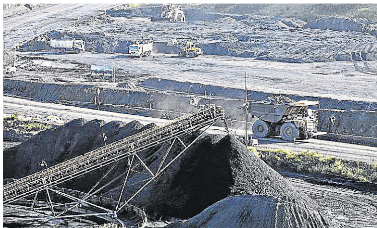
Mina de carbón de El Cerrejón.

“Hoy el mundo saca leyes, decretos y resoluciones para fomentar la inversión minera, para hacer que los países produzcan más, de manera responsable y más verde. Colombia saca lo mismo (resoluciones, leyes, decretos y nuevos impues-