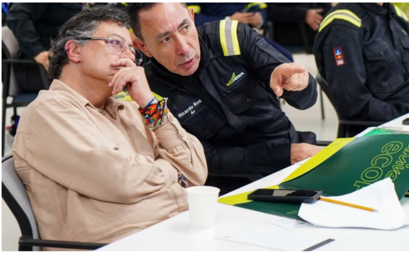
Petro defiende a Ricardo Roa en Ecopetrol pese a investigación penal.

Aunque la organización reconoció el principio de presunción de inocencia, advirtió que el contexto actual exige medidas que garanticen transparencia. En ese sentido, planteó que apartar temporalmente a Roa permitiría que concentre su defensa en los procesos judiciales, disciplinarios y administrativos que enfrenta.