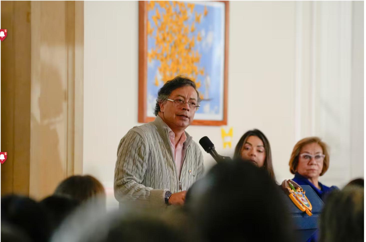
Petro defiende a Ricardo Roa en Ecopetrol pese a investigación penal.

Siga las noticias de El Universal en Google Discover