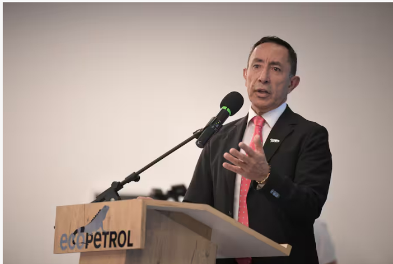
Presidente de Ecopetrol, Ricardo Roa. Imagen de referencia.