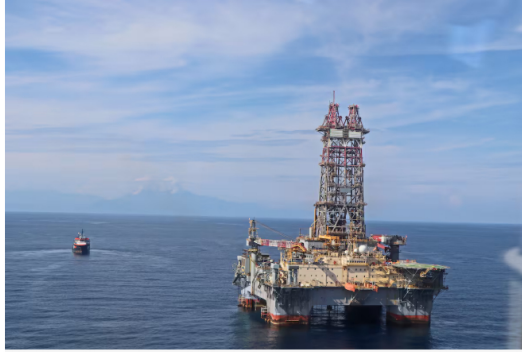
Ecopetrol y Petrobras anuncian nuevo hallazgo de gas en el Caribe colombiano.

Siga las noticias de Vanguardia en Google Discover