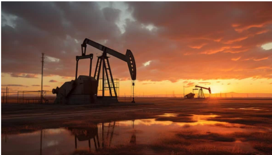
Producción petrolera en Colombia.

Por: Manuel Alejandro Correa - 2026-03-18