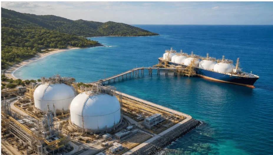
Punto de regasificación. Imagen: Generada con AI

Por: Rodrigo Torres Villamil - 2026-03-18