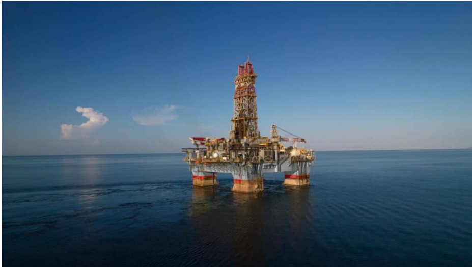
Ecopetrol desestima retos de viabilidad económica que advirtió ministro Palma para proyecto de gas Sirius.

Por: Rodrigo Torres Villamil - 2026-03-18