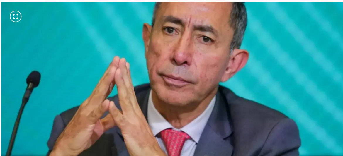
Ricardo Roa Barragán, presidente de Ecopetrol.

Advierte riesgos para la compañía y solicita a la junta directiva tomar decisiones para proteger su funcionamiento.