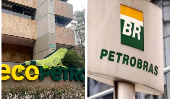
Ecopetrol y Petrobras confirman un nuevo yacimiento de gas en aguas del Caribe colombiano. Montaje hecho por la agencia API

La petrolera estatal colombiana Ecopetrol y la brasileña Petrobras confirmaron un nuevo descubrimiento de gas en aguas del mar Caribe, la misma zona donde están los mayores yacimientos de ese combustible en Colombia, informó este miércoles la primera compañía.