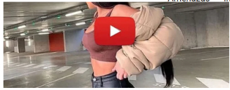
Bitcoin Bank La millonaria de 23 años de Chía comparte cómo se hizo rica

Amenazas • Imputan cargos • Indagación preliminar • Procesos judiciales