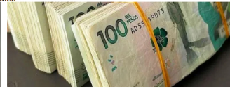
BTC Income Haz esto 15 minutos al día y gana 67 millones de pesos a la semana