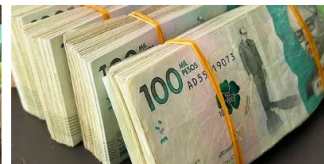
BTC Income Haz esto 15 minutos al día y gana 67 millones de pesos a la semana