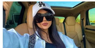
Bitcoin Bank De empleada bancaria a la mujer más rica de Chia