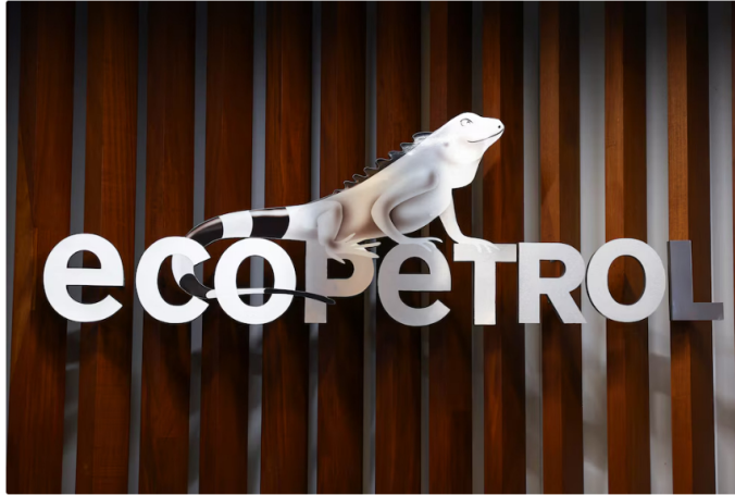
Los resultados superaron expectativas iniciales y ofrecen nuevas oportunidades para el aprovechamiento del subsuelo en Colombia, según Ecopetrol