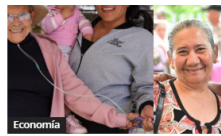
Renta Ciudadana y Devolución del IVA: pagos primer ciclo 2026