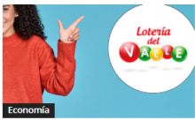
Resultados Lotería del Valle: Números ganadores del último sorteo