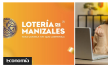
Lotería de Manizales: Resultados del sorteo del 18 de marzo 2026