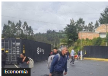
Economía Guerra Arancelaria Colombia-Ecuador: Crisis en Empresas de Ipiales