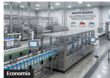
Economía Leche Algarra se va de Colombia: 150 empleos afectados por cierre