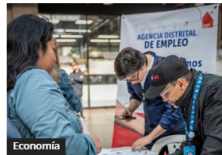
Economía Agencia de Empleo Bogotá: Vacantes y Asesoría en Engativá