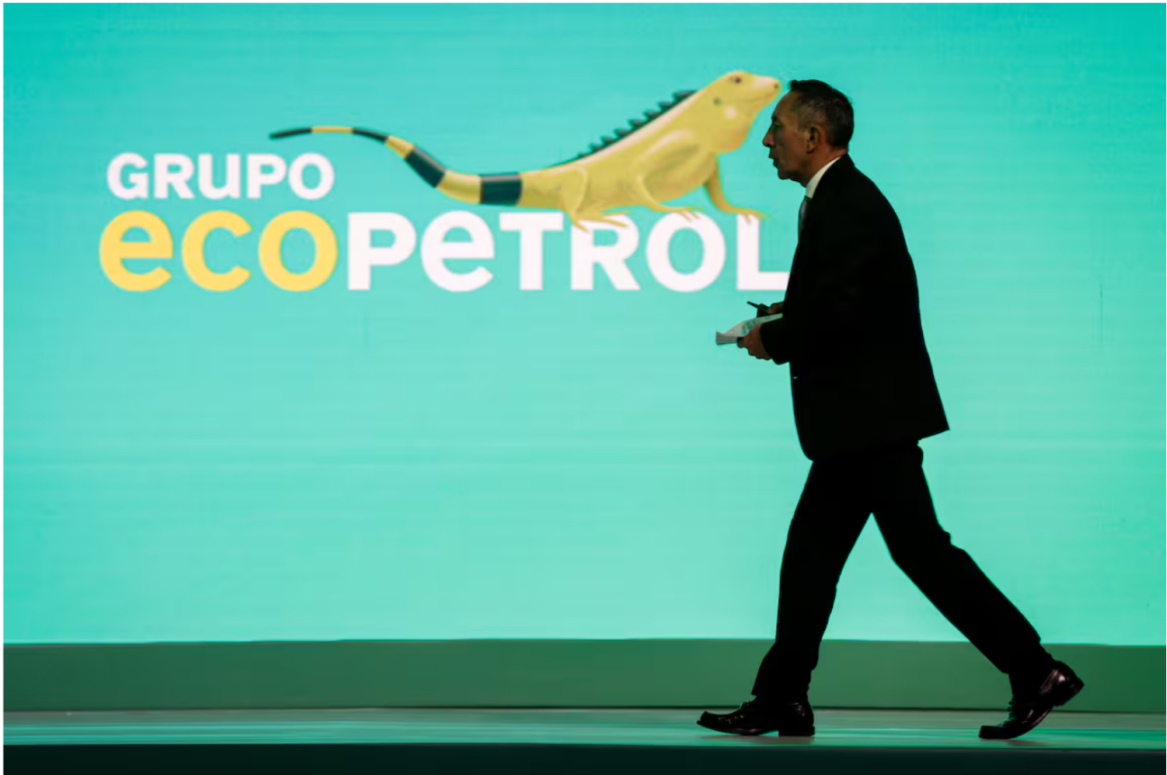
Ricardo Roa, presidente de Ecopetrol.

Siga las noticias de El Universal en Google Discover