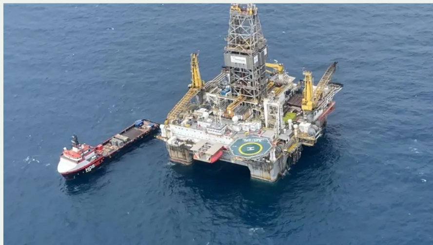
Plataforma offshore de Ecopetrol.