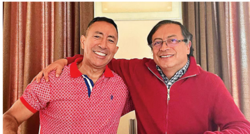
Ricardo Roa, actual presidente de Ecopetrol, fue gerente de campaña de Gustavo Petro.

Sobre la situación jurídica de Ricardo Roa, la USO reconoció el principio de presunción de inocencia, pero advirtió que los señalamientos penales, disciplinarios y administrativos agranan la situación de la compañía . El sindicato considera que estos riesgos podrían materializarse y afectar el cumplimiento de la estrategia empresarial y la confianza en el gobierno corporativo.