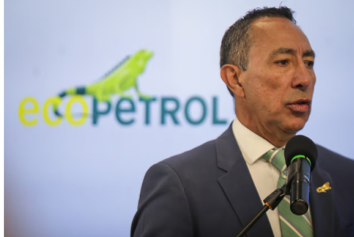
La Fiscalía General le imputó el delito de tráfico de influencias de servidor público al presidente de Ecopetrol, Ricardo Roa.

La organización sindical señaló que Ecopetrol requiere diseñar una reingeniería financiera inmediata que asegure los recursos necesarios para fortalecer el negocio tradicional de hidrocarburos. Según el comunicado, es urgente desarrollar campañas exploratorias de alta potencialidad para adicionar nuevas reservas de gas natural y petróleo en el corto plazo.