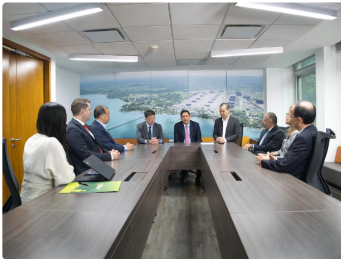
Firma del acuerdo entre Ecopetrol y Gran Tierra.

Asimismo, se espera que las nuevas operaciones aporten al abastecimiento energético del país, en un contexto en el que el sector petrolero continúa siendo una pieza clave para la economía colombiana.