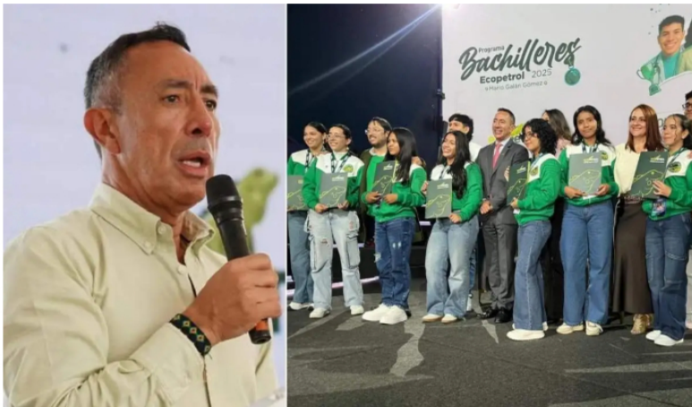
Cien estudiantes de 32 departamentos recibieron la beca universitaria Mario Galán Gómez.

La carta de aval de la institución educativa —que debe especificar la duración y los datos del estudiante— solo se le pedirá a quienes avancen hasta la fase de validación documental, la última etapa del proceso. Eso significa que los candidatos en etapas iniciales no necesitan tenerla lista desde el primer día, aunque conviene gestionarla con anticipación.