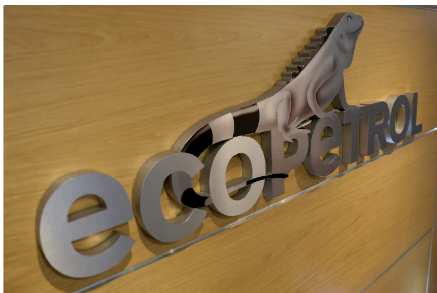
La presión financiera sobre Ecopetrol preocupa a sindicatos, que advierten sobre la necesidad de medidas estructurales para asegurar la inversión futura

La presión sobre las finanzas de Ecopetrol empezó a encender alertas dentro de la propia compañía. Desde los sindicatos advirtieron que, si no se ajusta el rumbo, la petrolera podría verse obligada a tomar decisiones de fondo, como desprenderse de activos, para poder cumplir con sus compromisos de inversión en los próximos años.