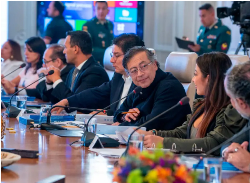
El presidente Gustavo Petro hizo el anuncio de liquidar EPS en un Consejo de Ministros el 16 de marzo.