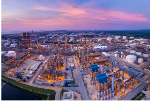
Refinería de Cartagena.

Siga las noticias de Vanguardia en Google Discover