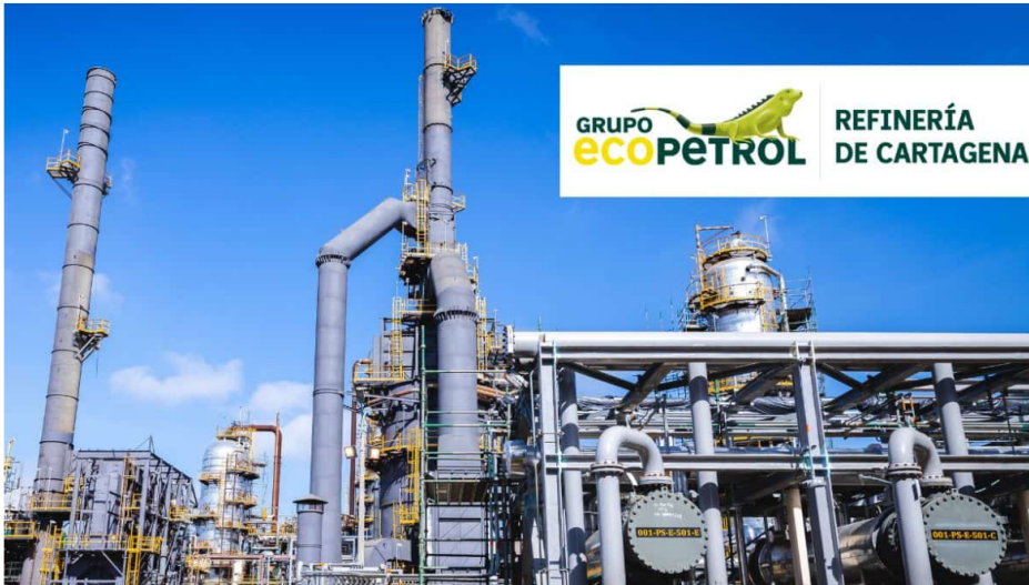
Refinería de Cartagena. Imagen: Refinería de Cartagena

Por: Manuel Alejandro Correa - 2026-03-16