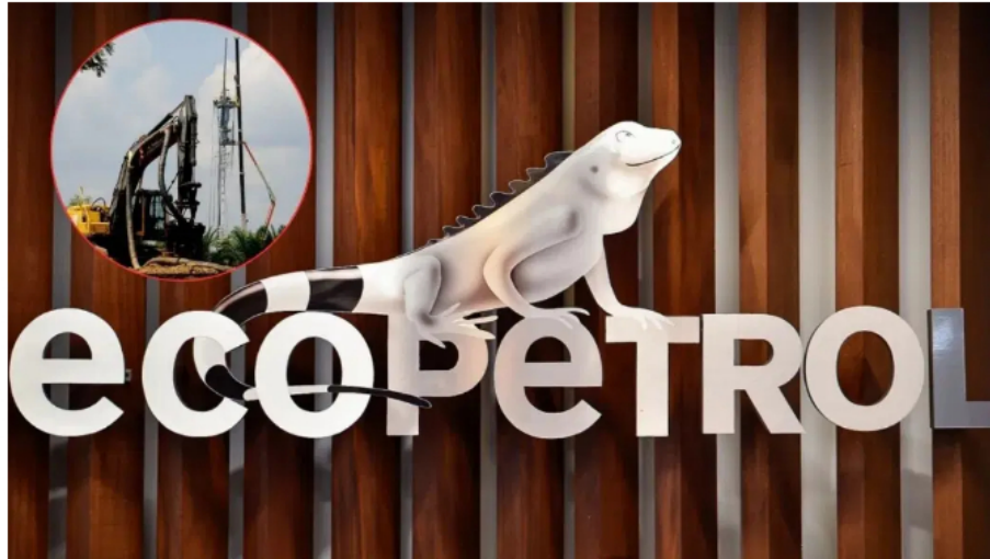
Mantener Ecopetrol en los próximos años tiene sus costos y Asopetrol plantea soluciones.

La Asociación Sindical de Empleados de la Industria Energética, Asopetrol, considera que la estatal petrolera tendría que vender activos, ¿por qué?