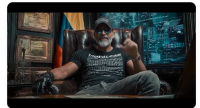
Publicidad política pagada

Desde 2022 el precio del petróleo ha caído en un 31 %, el EBITDA (indicador contable de cuánto gana una empresa) cayó en un 38% y la utilidad neta también cayó en un 73%, pese al incremento en la