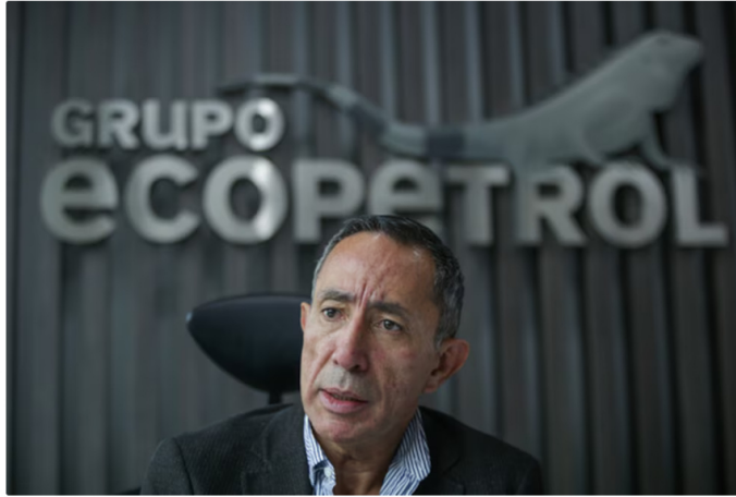
Ricardo Roa enfrenta cuestionamientos legales por polémica transacción inmobiliaria siendo presidente de Ecopetrol

definitiva del apartamento quedó a nombre de Roa, ya presidente de Ecopetrol cuando se completaron los pagos en 2023 y 2024.