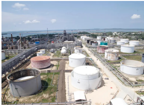
Vista de la Refinería de Cartagena, donde una falla en el suministro eléctrico obligó a apagar temporalmente las unidades de proceso.

Una falla eléctrica apagó unidades de proceso en la Refinería de Cartagena, pero Ecopetrol asegura inventarios suficientes y confirma que el suministro nacional de combustibles continúa normal.