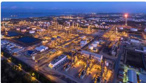
Refinería de Cartagena.

Tras conocerse la situación, la compañía activó el plan de contingencia para atender la interrupción y avanzar en el restablecimiento de las unidades de proceso que quedaron fuera de servicio.