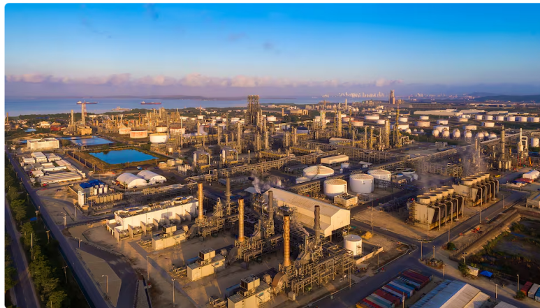
El hecho en la Refinería de Cartagena se registró este domingo 15 de marzo.

La empresa Ecopetrol informó sobre un apagado de varias unidades de proceso en la Refinería de Cartagena, que se registró este domingo 15 de marzo tras una afectación en el suministro de energía eléctrica.