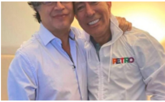
El presidente Gustavo Petro y Ricardo Roa en campaña.

Fuentes del ente acusador le confirmaron a EL TIEMPO que entre los interrogantes que enviaron desde la estatal petrolera -algunos de los cuales no serán contestados- está el número de procesos que se tienen abiertos actualmente contra Roa.