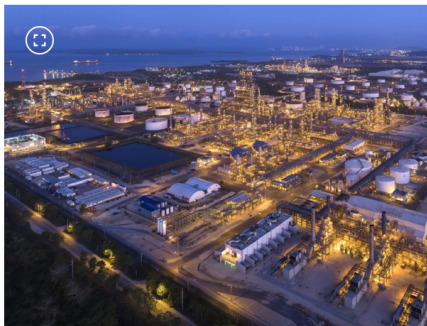
Refinería de Cartagena (Reficar)

Según explicó la empresa en un comunicado oficial, el evento se originó por una interrupción en el suministro eléctrico que impactó la operación del complejo.