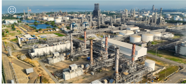
Refinería de Cartagena (Reficar)

Laura Nathalia Quintero PERIODISTA 16.03.2026 05:49 | Actualizado: 16.03.2026 06:03