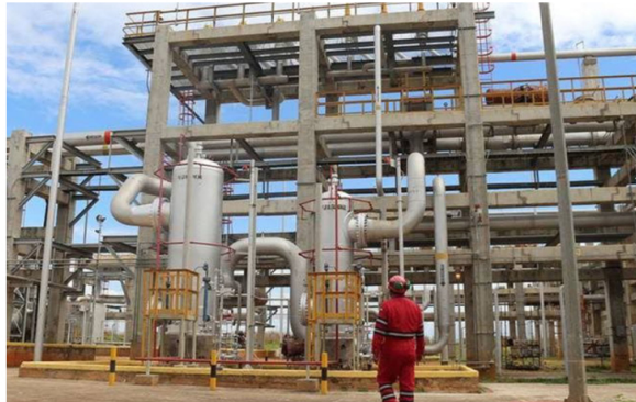
Crisis de inversión en el gasoducto binacional: El plan de Pdvsa que pone en jaque la alianza con Colombia.

El proyecto de interconexión gasífera entre Colombia y Venezuela atraviesa un momento de fragilidad administrativa. El ministro de Energía de Colombia, Edwin Palma Egea, reveló que Pdvsa puso sobre la mesa la posibilidad de finalizar el acuerdo estratégico que mantiene con Ecopetrol, debido al deterioro de la infraestructura y la inviabilidad financiera de su recuperación bajo el esquema actual .