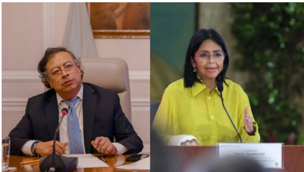
Presidente Gustavo Petro y presidente (e) de Venezuela, Delcy Rodríguez.