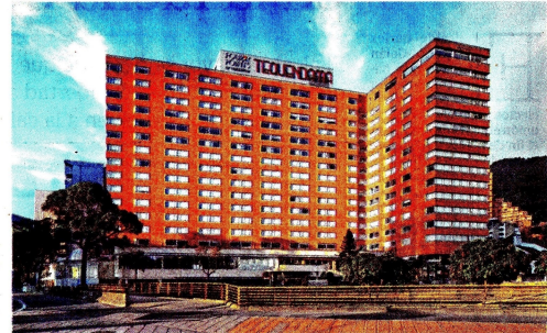
El Four Points by Sheraton Tequendama, ubicado en el Centro Internacional de Bogotá, hace parte del portafolio hotelero bajo la administración de GHL.