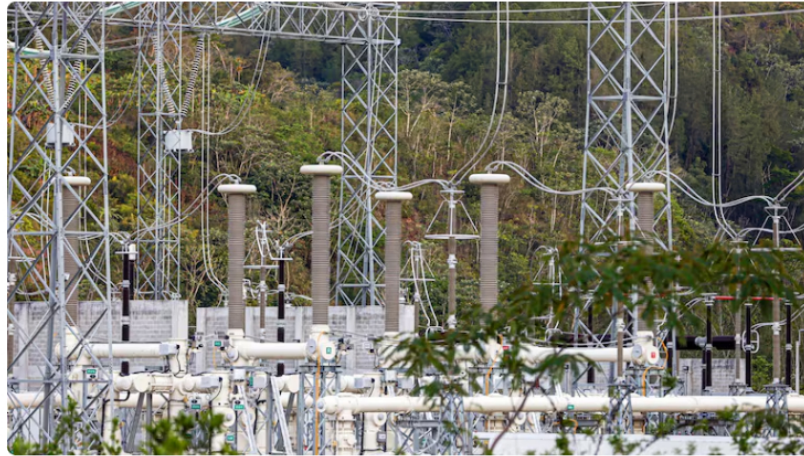
La principal actividad de ISA, que opera en varios países, es la transmisión de energía.

Desde 2021, Interconexión Eléctrica S.A. es controlada por Ecopetrol , que adquirió el 51,4 % de la participación accionaria. Aunque venía arrojando buenos resultados, en 2025 tuvo una caída de 14 % en las utilidades.