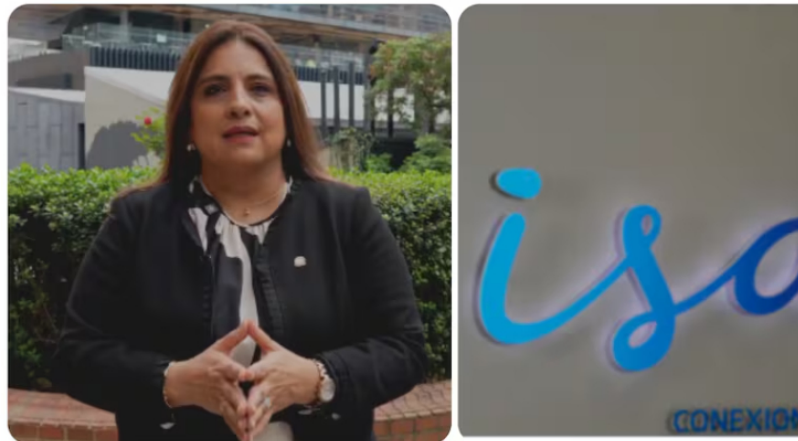
Paola Meneses Mosquera, presidenta de la Corte Constitucional, explicó la decisión tomada con un artículo del Plan de Desarrollo.

Otra mala noticia para la empresa ISA, filial de Ecopetrol . La Corte Constitucional resolvió una demanda contra un artículo del Plan de Desarrollo 2022-2026, es decir, "Colombia, potencia mundial de la vida", del gobierno de Gustavo Petro.