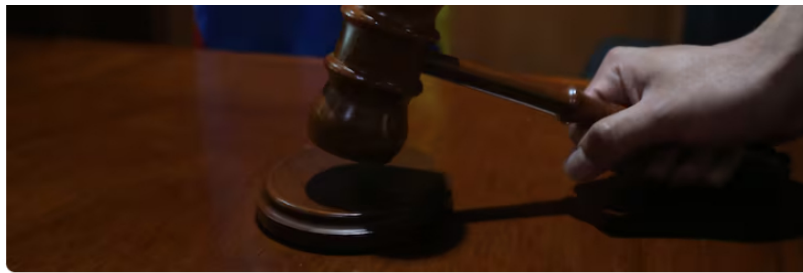
martillo de juez